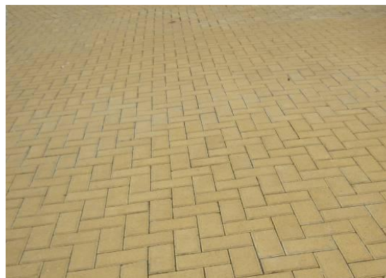
预制水泥及玻璃废料砖块