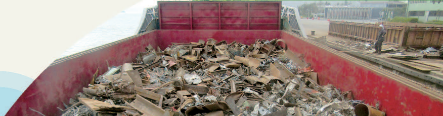
廢金屬▶切碎的金屬廢料